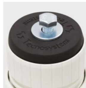
Śruba mocująca M8