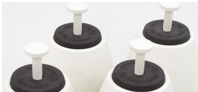
Trzpień szybkiego mocowania