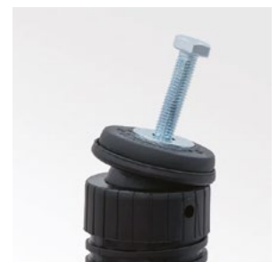
Regulowany kąt 0-15°